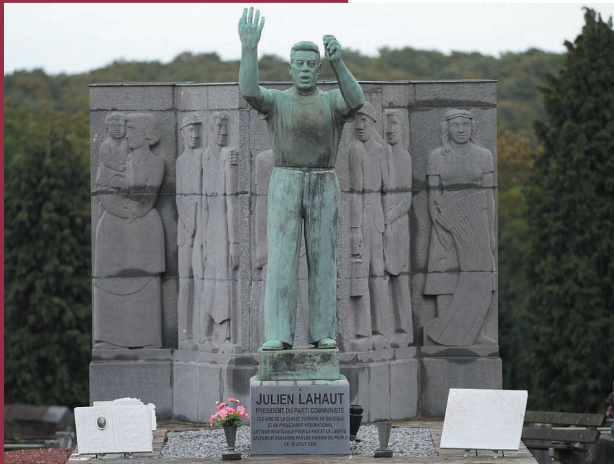
Statue de Julien Lahaut au cimetière de Seraing.

guerre, revient discrètement – il se sait impopulaire auprès d'une population qui a dû faire face à l'Occupation, elle. De plus, la popularité des résistants – dont, évidemment, les communistes comme Julien Lahaut – est immense. Malgré cela, le pouvoir – aux mains des partis traditionnels, qui exclu le PCB temporairement – refuse de revenir en arrière et il faut une mobilisation massive des travailleurs pour que l'establishment cède, de peur de perdre beaucoup plus que les concessions accordées aux travailleurs. En 1944, le « Pacte social » est signé et renforce le pouvoir des syndicats et des mutuelles.