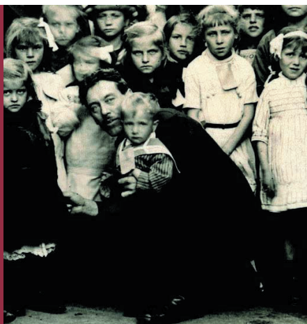
Julien Lahaut avec des enfants de travailleurs grévistes d'Ougrée-Marihaye, entreprise sidérurgique sérésienne, qui vont être envoyés dans des familles d'accueil jusqu'à la fin d'une longue grève.

À cette période, l'extrême droite grandit. Déjà en 1924, galvanisés par Mussolini, les premiers fascistes organisés en milice tentent une démonstration de force en manifestant à Liège. Lahaut et un groupe de métallurgistes, bien conscients du danger que représente le fascisme pour les travailleurs, les font fuir. Le 1er mai 1933, en réaction au coup d'État nazi en Allemagne, un cortège de Jeunes Gardes socialistes – organisation de jeunesse satellite du POB mais autonome par rapport au parti et engagée fermement dans la lutte antifasciste – arrache du consulat allemand le drapeau à croix gammée. Le député le brandit au Parlement pour dénoncer la complaisance de la droite envers Hitler. À l'Expo universelle de Bruxelles en 1935, Lahaut perturbe le pavillon de l'Italie mussolinienne. Loin de se contenter de slogans, son antifascisme s'illustre concrètement. En Espagne, les forces populaires du gouvernement démocratique de gauche sont en guerre contre les troupes franquistes, puissamment armées par Hitler et Mussolini. Le PCB organise de grandes collectes de solidarité pour la République espagnole. Lahaut conduira deux convois de vivres à Valence et Madrid. Il encourage les volontaires des Brigades internationales à lutter les armes à la main contre les fascistes et héberge trois enfants de républicains. À la Chambre, le député demande en 1939 au gouvernement d'en faire autant avec les enfants juifs, traqués par l'Allemagne nazie.