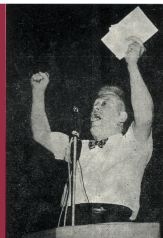
Julien Lahaut était connu (et reconnu) pour ses discours enflammés...