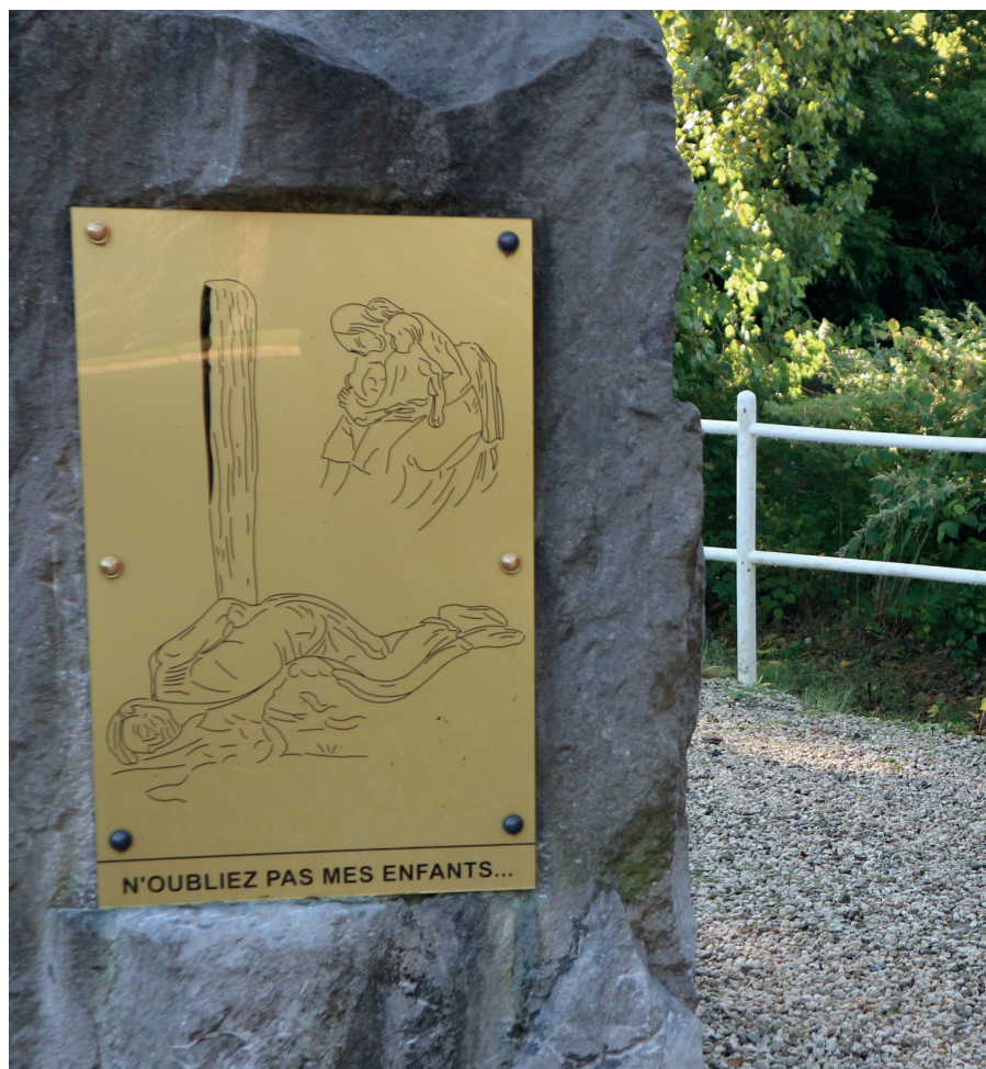
A l'entrée de l'Enclos des Fusillés