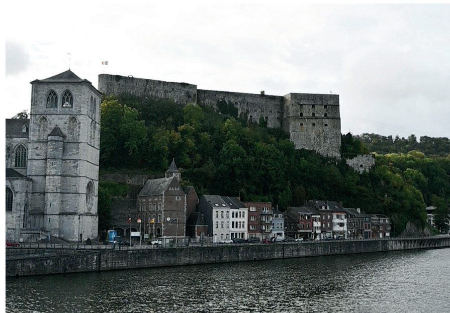
Fort de Huy, de l'extérieur